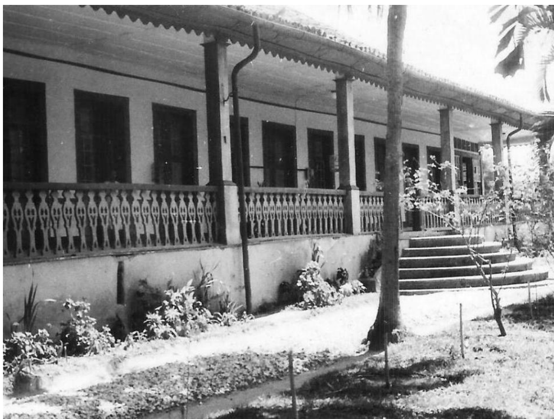
Fazenda de café em Vassouras - 1958