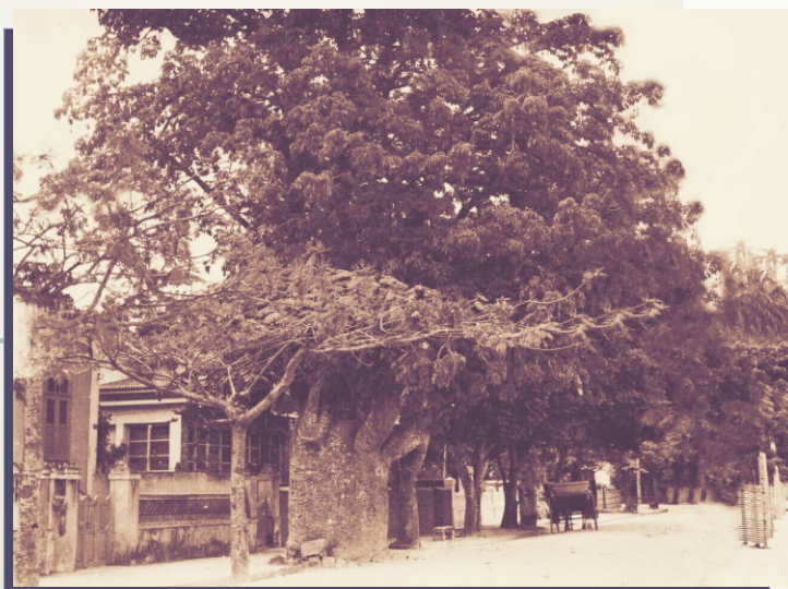
Mangueira na rua Tomás Cerqueira, defronte ao nº 73