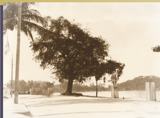
Tamarineira na praia Marechal Floriano defronte ao nº 258