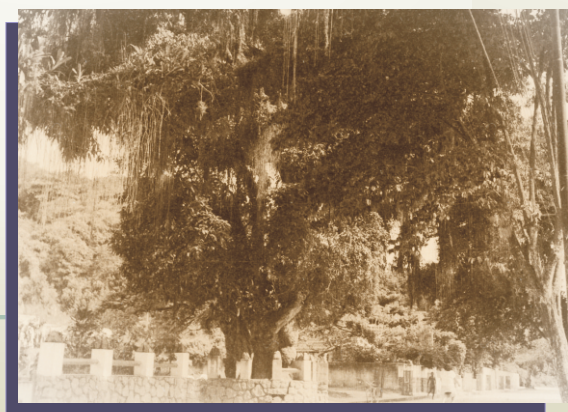
Tamarineira na praia José Bonifácio, defronte ao nº 221