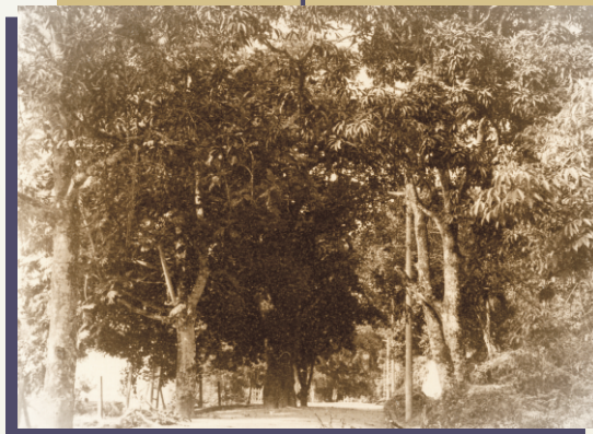
Jaqueira na rua Comandante Guedes de Carvalho, defronte aos fundos do terreno nº 199, da praia