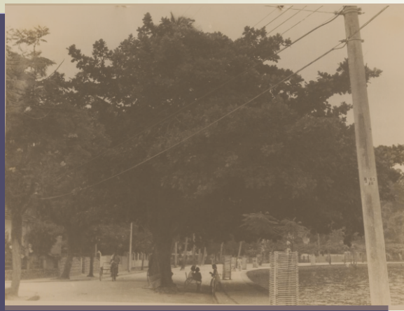
Amendoeira, na praia dos Tamoios, esquina com a ladeira do Vicente

As dez árvores abaixo listadas situam-se em praças e ruas de Paquetá, e foram tombadas pela sua importância na paisagem da Ilha (fotos de 1967):