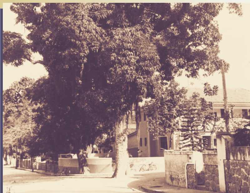
Mangueira na rua Frei Leopoldo, esquina da rua Joaquim M.I Macedo nº 87