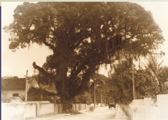
Mangueira na rua Padre Juvenal, defronte ao nº 44