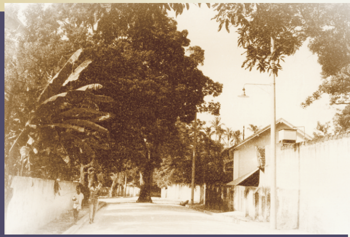
Mangueira na rua Comandante Guedes de Carvalho