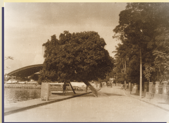
Algodoeira de Praia na praia Marechal Floriano (início)