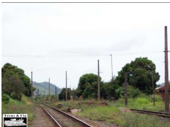
© Jorge A. Ferreira Jr. - 03/2003

Componentes do Sítio Ferroviário: plataforma, via férrea e caixa d' água