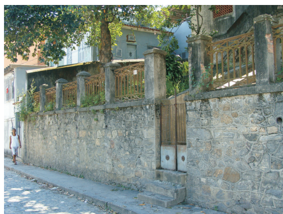
Muro e portão de entrada do Reservatório