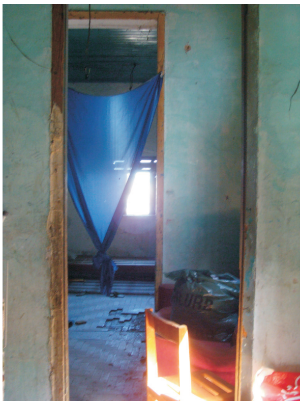
Interior da casa do encarregado