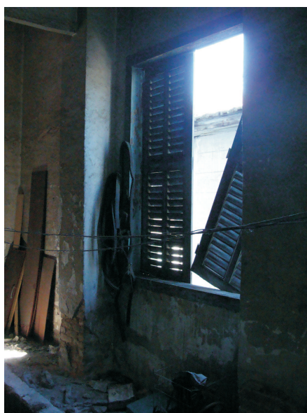
Esquadria danificada no reservatório