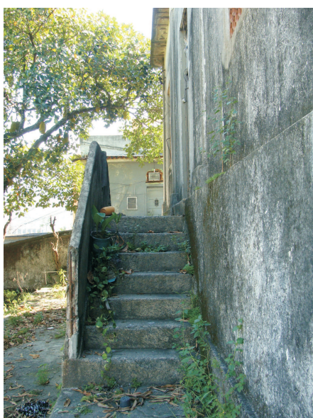
Escada de acesso danificada

O estado de conservação da casa do encarregado é também bastante precário. Foram relatados inúmeros vazamentos no telhado, o que provocou a deterioração de partes dos tetos em madeira. Algumas folhas das janelas estão soltas, assim como parte dos tacos do piso. As pinturas internas e externas estão desgastadas e há muito lixo no interior dos cômodos. Houve acréscimos de paredes também na área de serviço. No entanto, tais problemas são sanáveis e a casa é perfeitamente