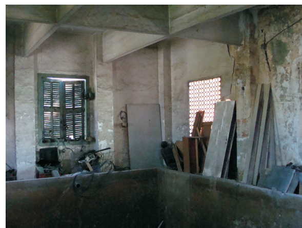
Interior do reservatório - 2013