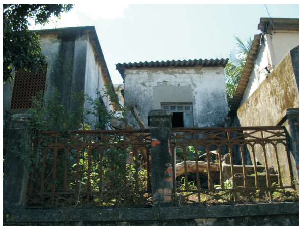
Frente da casa do Encarregado - provável acréscimo Foto Roberto Anderson - 2013