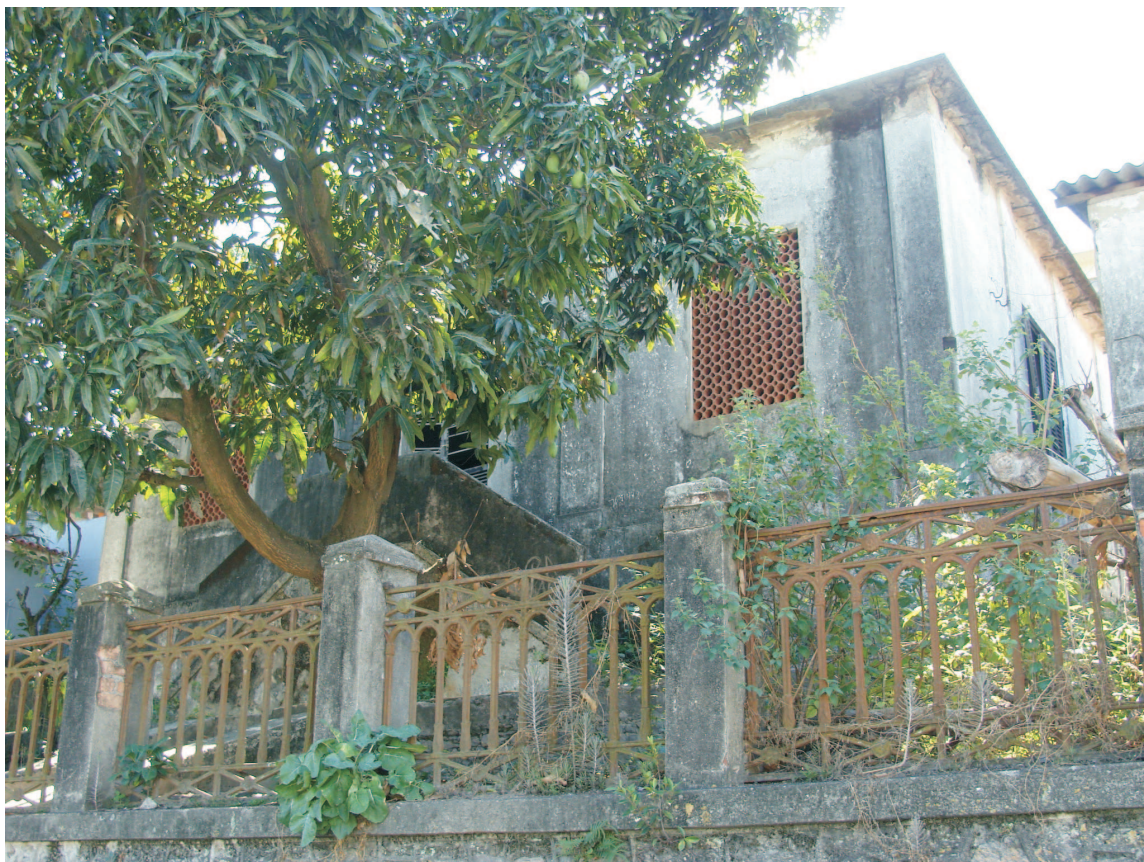
Reservatório visto da rua. 2013