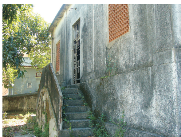
Escada de acesso ao reservatório - 2013