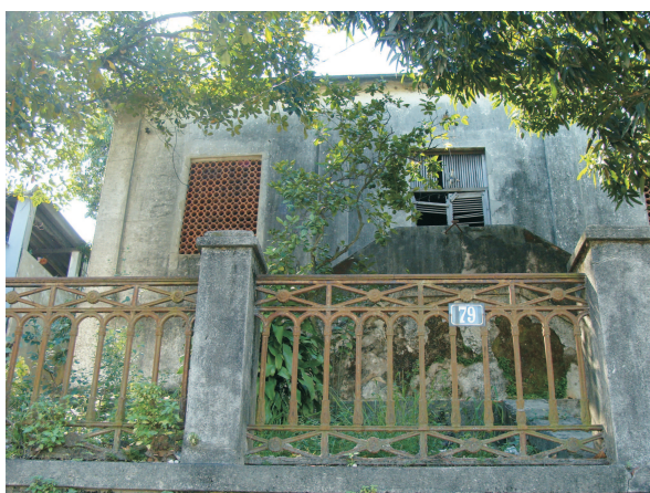
Reservatório - 2013

As paredes externas da casa são em alvenaria com rusticações. As janelas e portas têm esquadrias de madeira, com venezianas e quadros de vidros, com bandeiras também envidraçadas. Externamente apresentam cercaduras em argamassa, encimadas por duplo arco abatido. Os espaços internos são relativamente pequenos e os pés direitos são altos. Os tetos apresentam forros de madeira em macho e fêmea. Os pisos dos cômodos são em tacos de madeira. A cobertura é em telhas cerâmicas com beiral e forro de madeira sob o beiral.