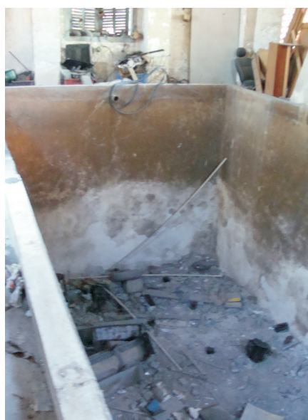
Lixo no interior da bacia do reservatório