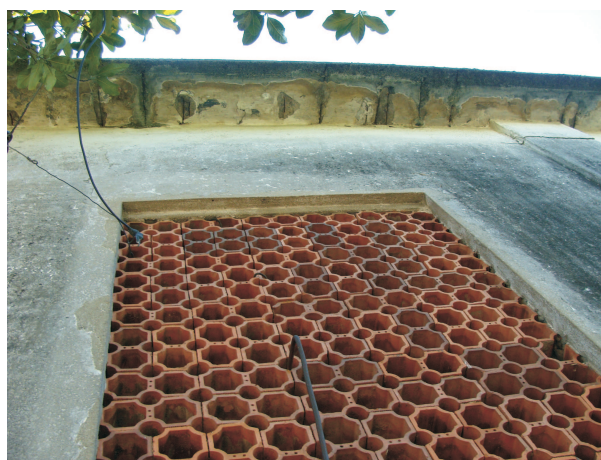
Ferragens aparentes na laje de cobertura do reservatório