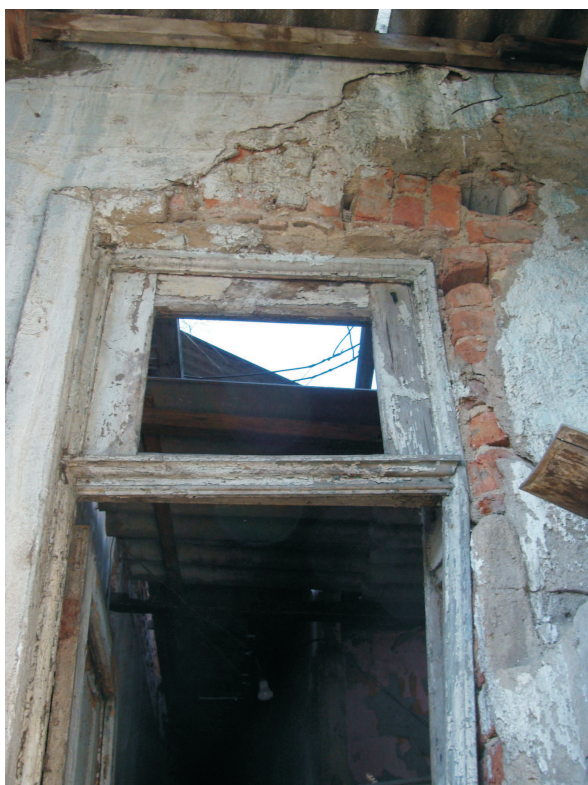
Parede colapsando na casa do encarregado Foto Roberto Anderson - 2013