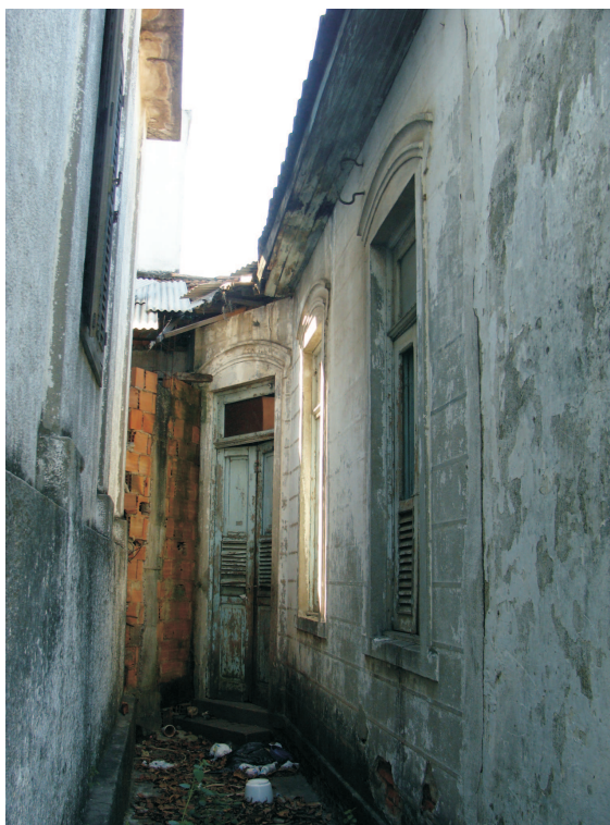
Exterior da casa do encarregado