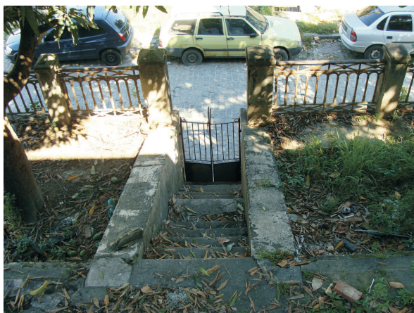
Escada de acesso ao terreno - 2013