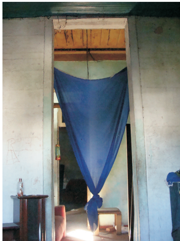
Parede do interior da casa do encarregado com rusticações indicando provável acréscimo - Foto Roberto Anderson - 2013