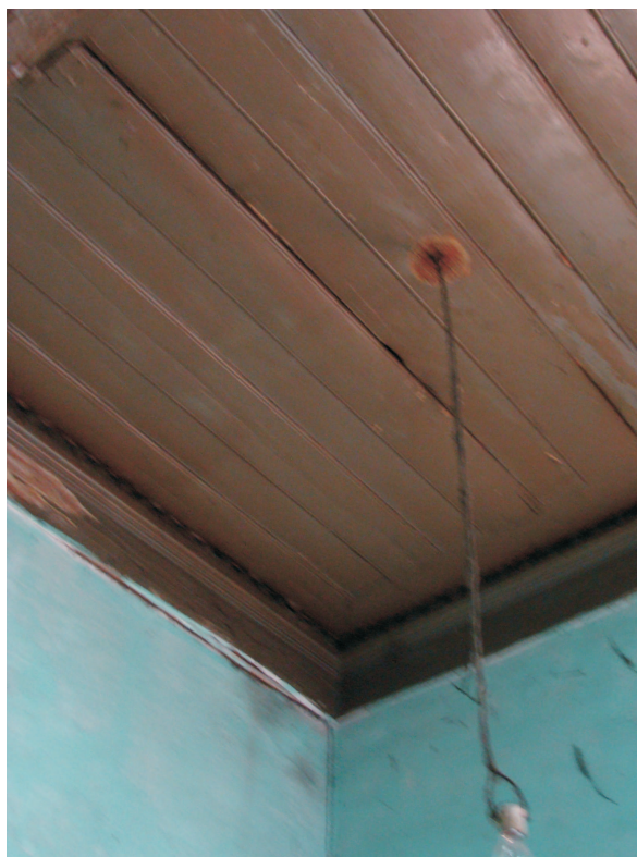
Forro do teto da casa do encarregado