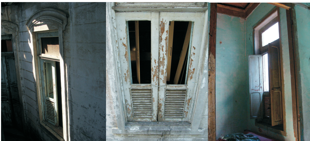
Esquadrias da casa do encarregado