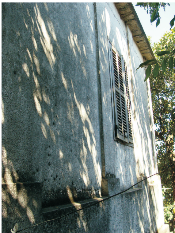
Exterior do reservatório