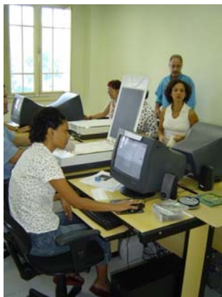
Digitalização do acervo do MIS

No entanto, este acervo não se encontrava acessível ao público, em função das suas precárias condições e da impossibilidade de serem manuseados. Assim, foi criado o projeto de digitalização de 20.000 partituras, considerado a melhor opção técnica para a conservação dos documentos e para a disponibilização das informações nelas contidas. Deverá, também, ser criado um banco de dados para disponibilização das partituras digitalizadas e 100 dos mais importantes títulos digitalizados passarão por editoração eletrônica.