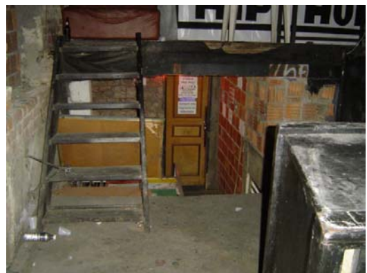
Estrutura da laje alterada e circulação vertical inadequada