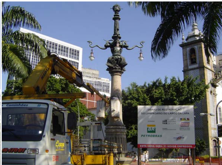
Remontagem do lampadário e colocação de luminárias - janeiro/2006