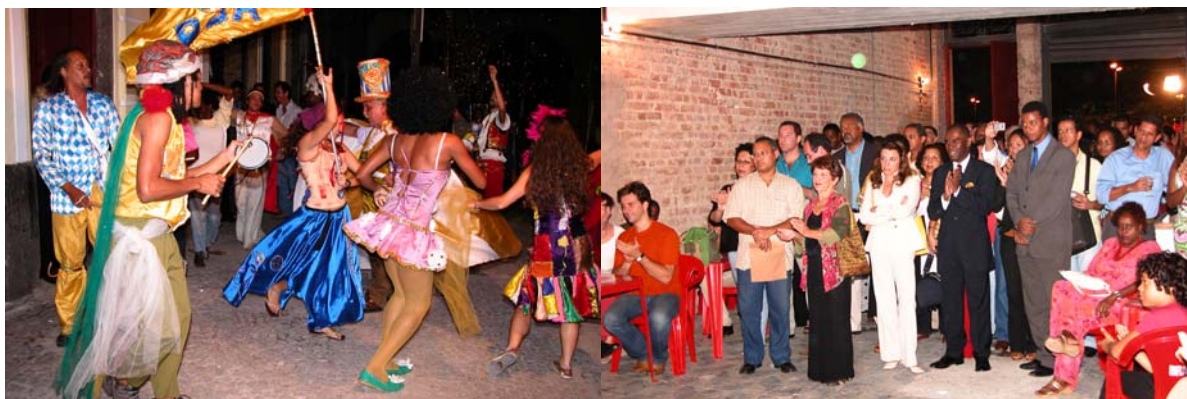
Inauguração das obras da FEBARJ e do Instituto Palmares/ Casa Brasil-Nigéria em 17.08.2005