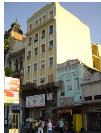
Museu da Imagem e do Som – antes (2004) e durante as obras (2005)