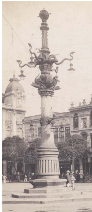
Lampadário da Lapa início séc. XX

Inicialmente, foi feita a desmontagem de todas as peças, que se encaixam como anéis numa coluna metálica no interior do monumento. Foram, então, sanados problemas, como acréscimos em ferro (barras e parafusos) às peças em bronze, que produzem oxidação desse material; desaparecimento de partes metálicas, como as línguas das serpentes ou os florões e suportes das luminárias mais baixas e falta de reforço estrutural para peças mais robustas. Foi, também, refeita a instalação elétrica do monumento, já que a mesma estava inutilizada, foram reinstaladas as luminárias, e foi realizada a limpeza da coluna e da base em granito.