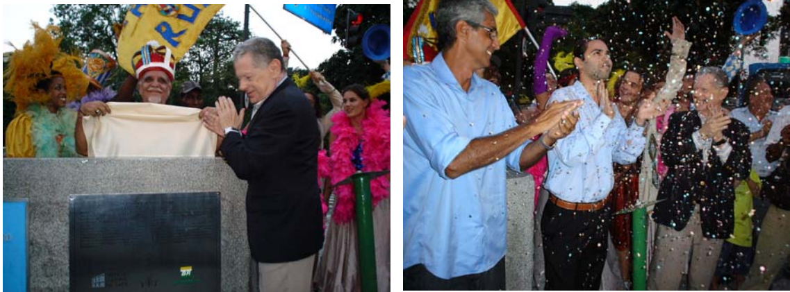
Amir Hadad, o Secretário de Estado de Cultura, o Diretor do INEPAC e o Representante da PETROBRAS

A entrega das obras de restauração do lampadário ocorreu no dia 18 de janeiro de 2006, com a presença de autoridades como o Secretário de Estado de Cultura, o Cônsul de Portugal e o Diretor do INEPAC. A festa foi conduzida pelo grupo Tá na Rua, com a participação do grupo de percussão da Escola Villa-Lobos, o que lhe conferiu um clima bem carioca.