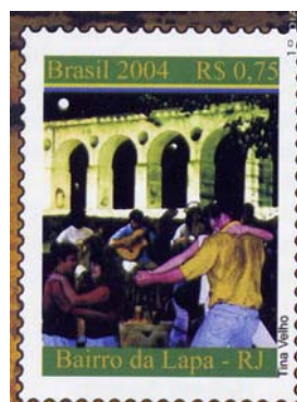
selo alusivo à Lapa

Em 2002 foi feito o lançamento festivo do projeto e teve início o levantamento das fontes de pesquisa documental e iconográfica sobre a área, que deverão servir como subsídio para o futuro Centro de Documentação da Lapa. Tal centro, projetado para ocupar o imóvel em ruínas da Avenida Mem de Sá 41, teve suas obras iniciadas no mesmo ano, mas, por falta de recursos, foram paralisadas logo em seguida.