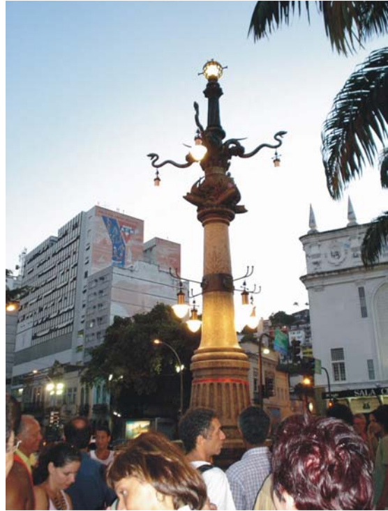
Grupo Tã na Rua e população na entrega das obras de restauração do Lampadário da Lapa