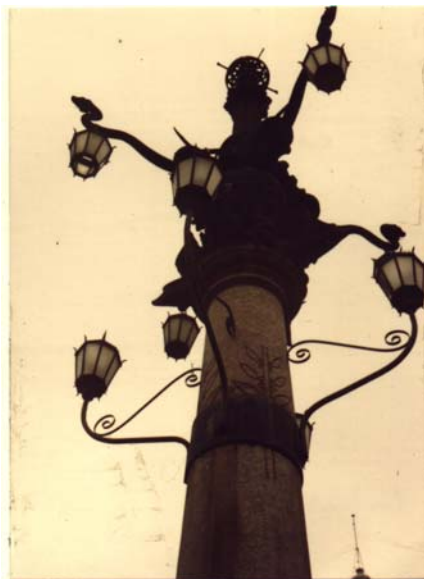
Lampadário com luminárias alteradas em 1996