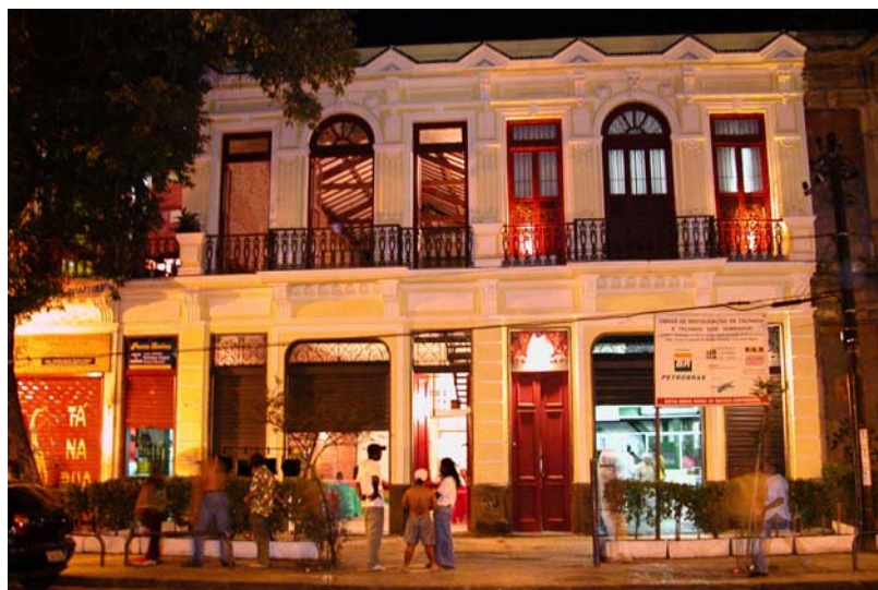
Mem de Sá 37 e 39 na noite de inauguração em 17.08.2005

No dia 17 de agosto de 2005, com uma grande festa da qual participaram grupos artísticos, como o "Tá na Rua", o "Hombu" e vários blocos afros, foram inauguradas as obras de recuperação dos sobrados que sediam a Federação de Blocos Afros e Afoxés do Estado do Rio de Janeiro e o Instituto Palmares/ Casa Brasil-Nigéria.