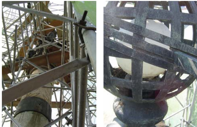
Detalhes do Lampadário da Lapa