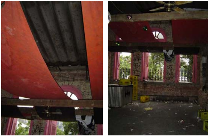
Cobertura com telhas de amianto e laje do segundo andar fora do nível das sacadas

cobertura original em telhas cerâmicas, com as estruturas do segundo andar comprometidas e as fachadas deterioradas. Assim, a sua recuperação constou da reconstrução tanto da cobertura como de todo o seu interior, incluindo as lajes dos dois pisos e a restauração da fachada.