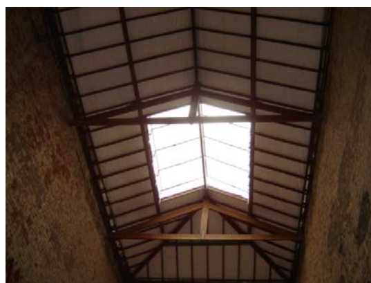
Construção da clarabóia