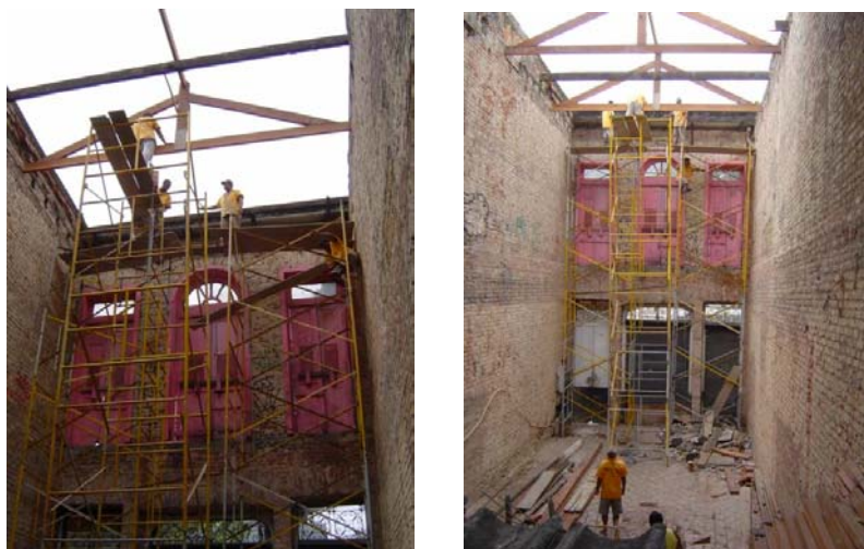
Reconstrução da cobertura