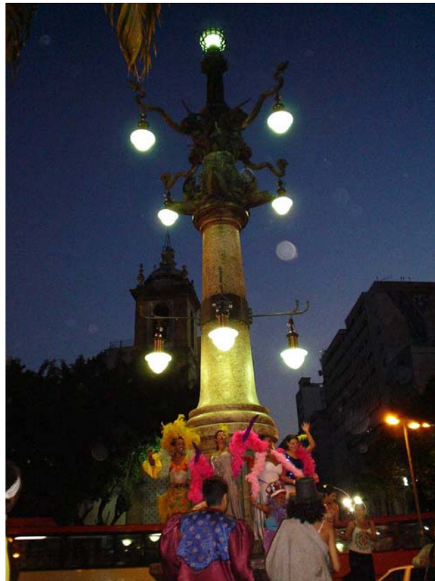
Lampadário da Lapa novamente iluminado