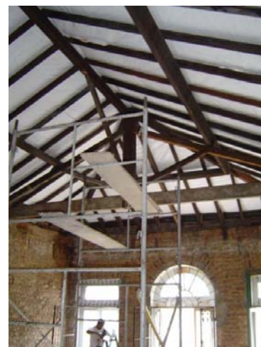
Recuperação da fachada e do telhado da Casa Brasil-Nigéria