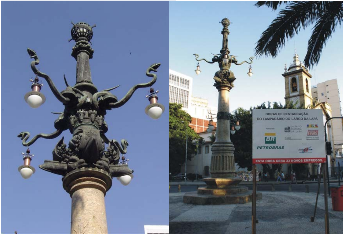
Lampadário restaurado – janeiro/2006

A entrega das obras de restauração do lampadário ocorreu no dia 18 de janeiro de 2006, com a presença de autoridades como o Secretário de Estado de Cultura, o Cônsul de Portugal e o Diretor do INEPAC. A festa foi conduzida pelo grupo Tá na Rua, com a participação do grupo de percussão da Escola Villa-Lobos, o que lhe conferiu um clima bem carioca.