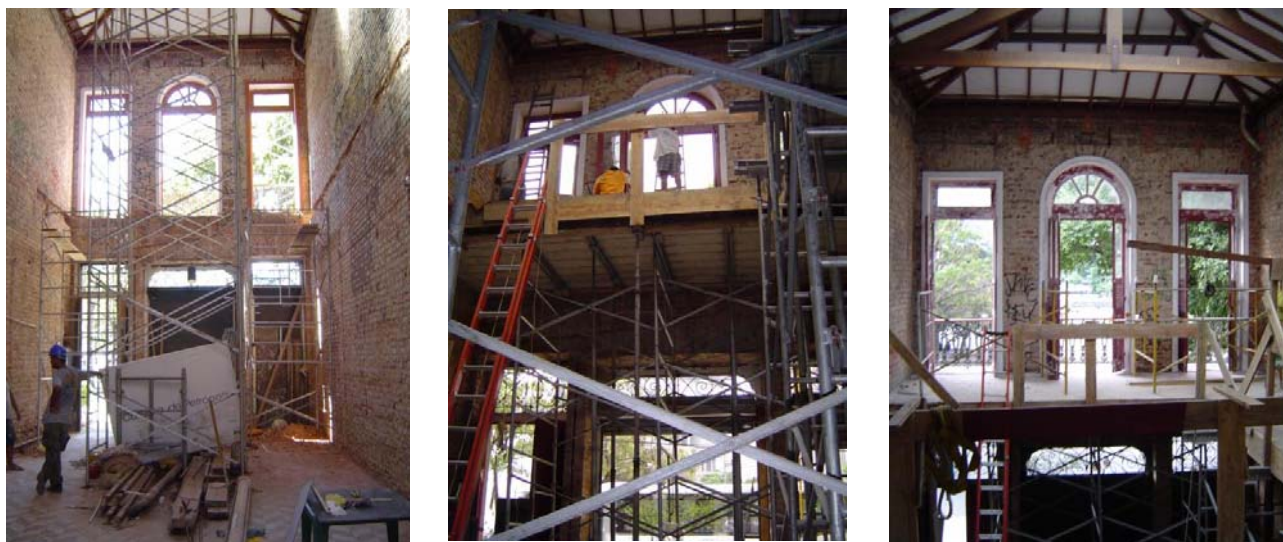
Obras no interior da Av. Mem de Sá 37 e construção do novo piso