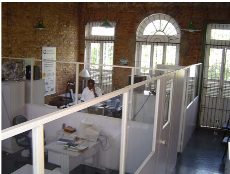
Interior da Casa Brasil-Nigéria já recuperada