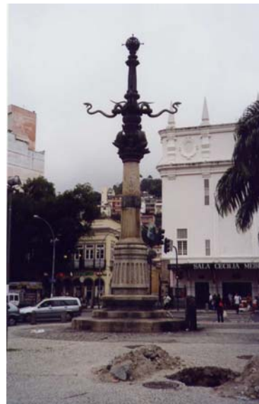
Lampadário sem luminárias em 2004