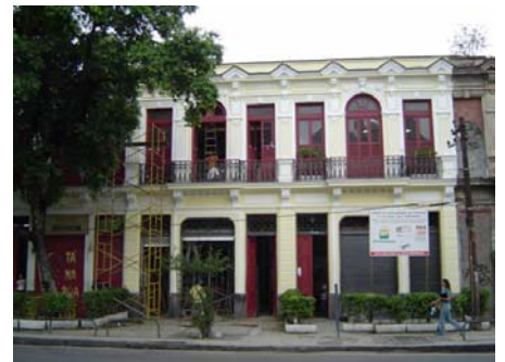
Fachada dos imóveis à Av. Mem de Sá 37 e 39 em 2004 e em 2005