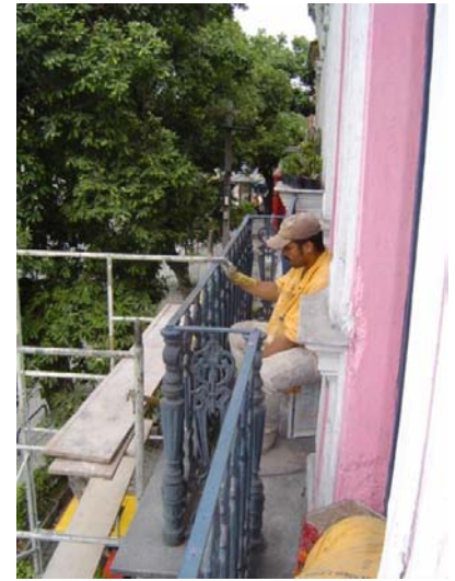
Recuperação das esquadrias e do gradil dos balcões