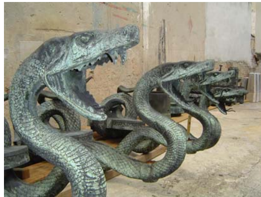
Desmontagem do lampadário e peças já desmontadas – outubro/2005