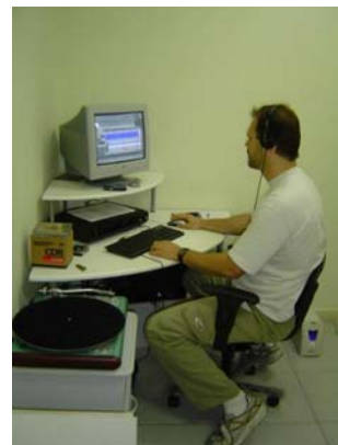
Laboratório de som